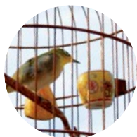
Oiseaux en cage