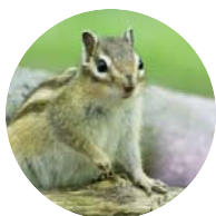
Ecureuil de Corée