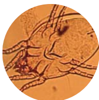
D. pteronyssinus femelle

Avec notamment Dermatophagoïdes pteronyssinus , Dermatophagoïdes farinae et Euroglyphus maynei , qui sont les espèces les plus répandues.