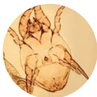
D. farinae mâle